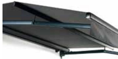
FA45 CROSS OVER