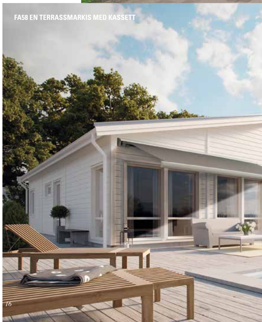
FA58 EN TERRASSMARKIS MED KASSETT